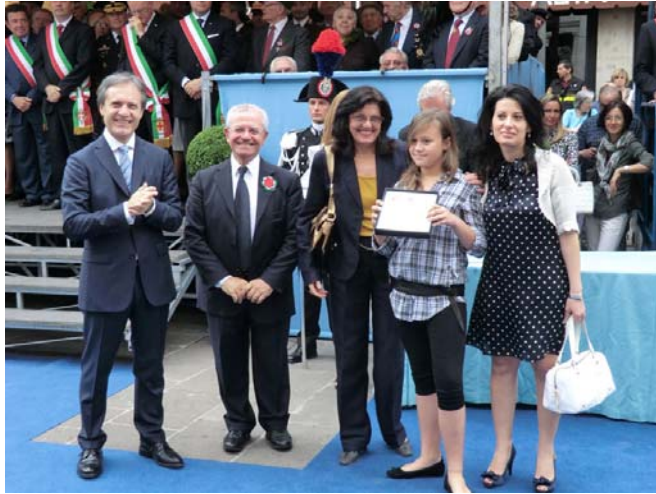
2 GIUGNO 2011 Piazza dei Signori Vicenza La scuola Giuriolo riceve dal Prefetto una targa di merito per il suo impegno civile e democratico